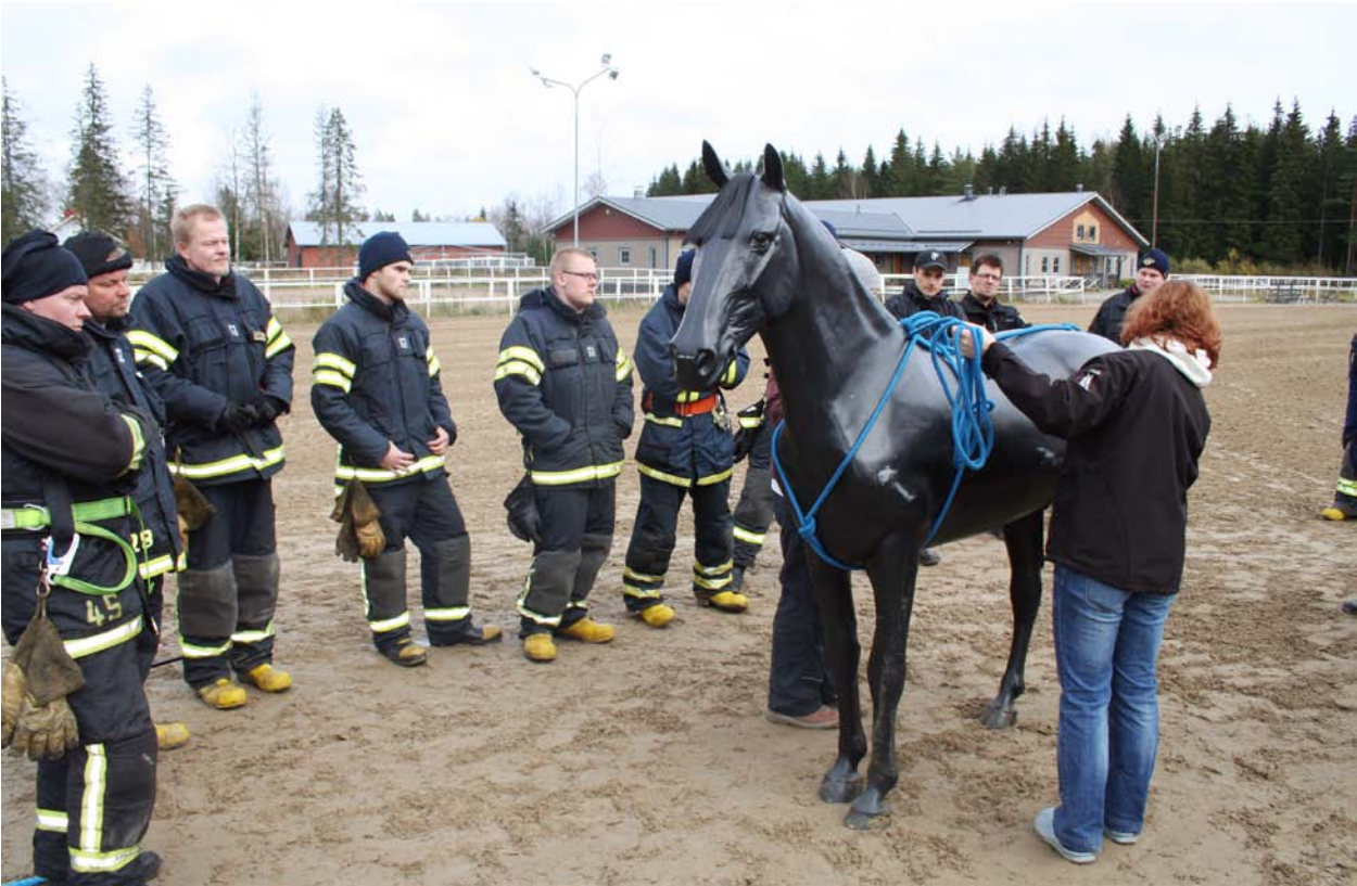
▲ Suurelänpelastuskurssilla. Tässä harjoitellaan nostovaljaan tekoa hätätilannetta varten.